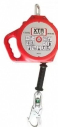
Страховочное Устройство Втягивающего Типа