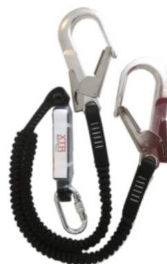
Двойной Страховочный Строп